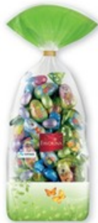
CHOCOLADE EIEREN FAIRTRADE COCOA PROGRAM € 2,99 / 400 g 7,48 EUR/kg - 29211